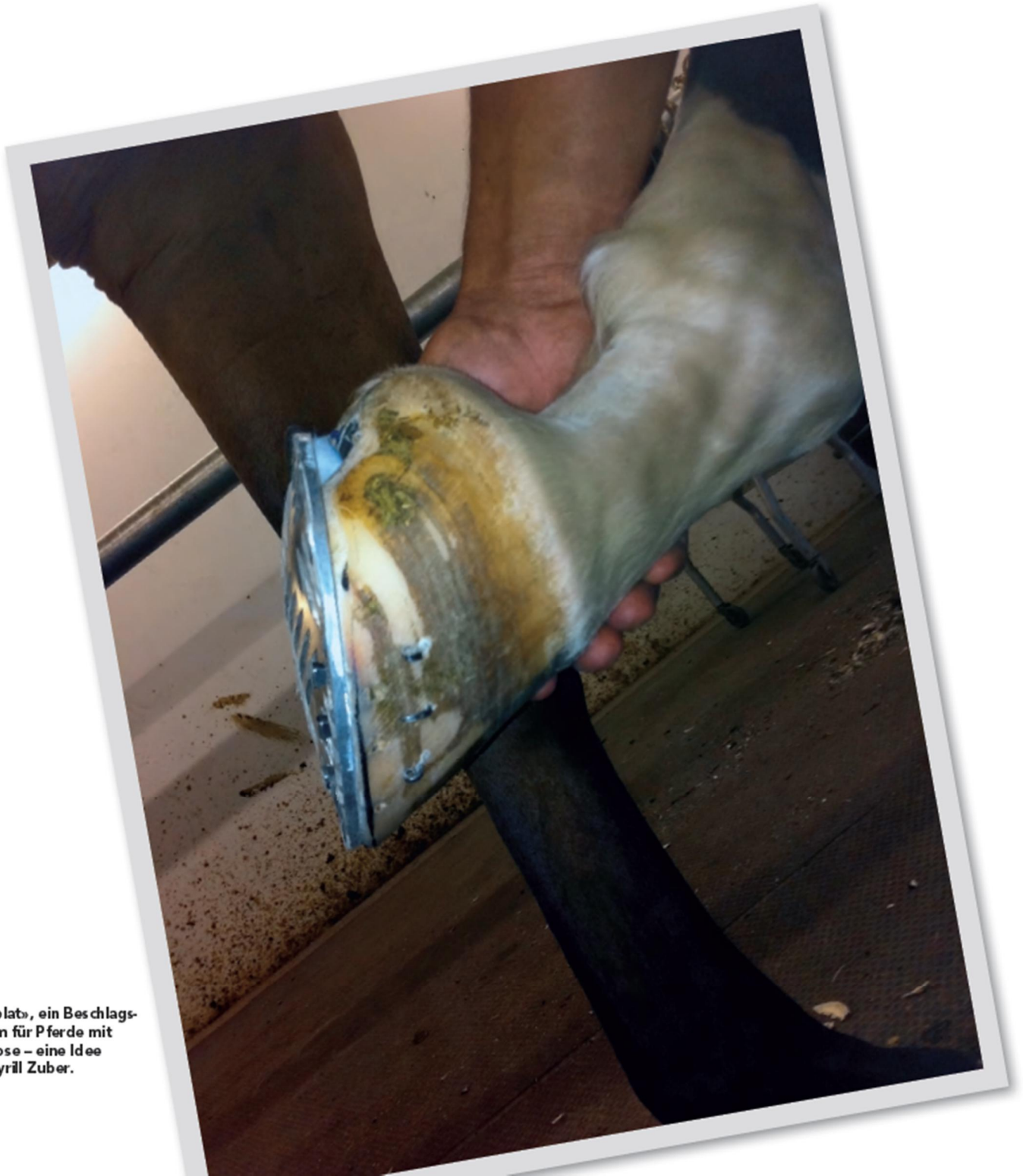
«Eggplate», ein Beschlagsystem für Pferde mit Arthrose – eine Idee von Cyril Zuber.

Die Pferdewelt ist im Wandel. War das Pferd früher fast ausschliesslich ein Arbeitstier und wurde in der Landwirtschaft und im Militär eingesetzt, ist die heutige Verwendung mehrheitlich im Sport und Freizeitbereich zu finden.